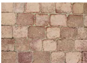
Pavés Floréal teinte Automne dim. 12x18/12x15/12x12x6 cm

L'identification du type de pavé par une photo sert à donner une idée approximative du produit. Elle ne constitue en aucun cas un engagement sur le plan de la couleur.