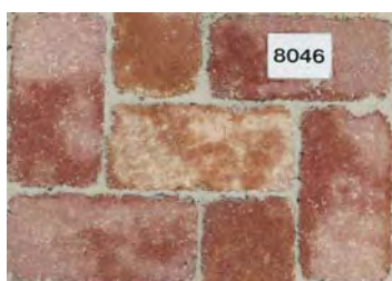
Pavés Castille teinte Automne dim. 24x12x6 cm

L'identification du type de pavé par une photo sert à donner une idée approximative du produit. Elle ne constitue en aucun cas un engagement sur le plan de la couleur.