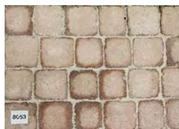
Pavés Cordouan teinte Provence dim. 15x15/15x17,5x6 cm

Prix: 40.- m2 / HT au lieu de 53.70 m2 / HT