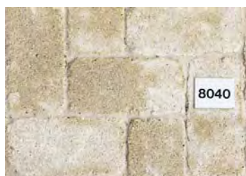
Pavés Castille teinte Pierre dim. 24x12x6 cm

Prix: 40.- m2 /HT au lieu de 48.50 m2 / HT