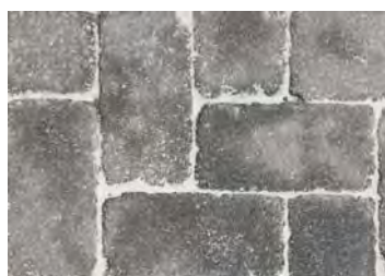
Pavés Castille teinte Anthracite dim. 24x12x6 cm

Prix: 40.- m2 /HT au lieu de 48.50 m2 / HT