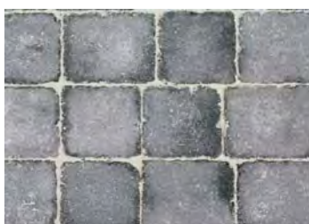
Pavés Cordouan teinte Anthracite dim. 15x15/15x17,5x6 cm

Prix: 40.- m2 / HT au lieu de 53.70 m2 / HT