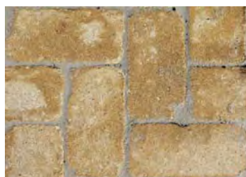
Pavés Castille teinte Paille dim. 24x12x6 cm

Prix: 40.- m2 /HT au lieu de 48.50 m2 / HT